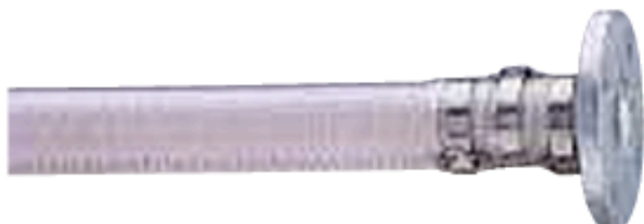
Flat band swaging (JIS Flange) บีบอัดแถบรัดแบบเรียบ (หน้าแปลน JIS)